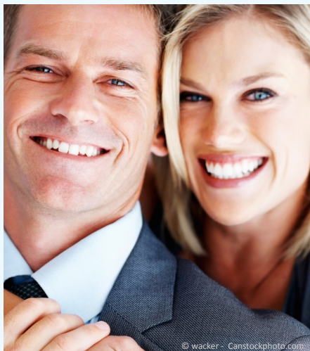
Selbstsicher mit gepflegten Zähnen

Dann werden Mund, Zähne und Zahnfleisch untersucht. Die Zahnbeläge werden angefärbt, um sie besser sichtbar zu machen und es wird die Tiefe der Zahnfleischtaschen gemessen.